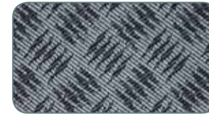
Techno mit Aufpreis

... denn mit uns kommen Sie ans Ziel !!!