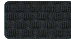
LR 02 mit Aufpreis